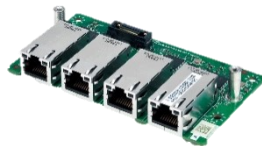
1GbE LAN x4 RJ45