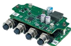
1GbE PoE+ LAN x4 M12