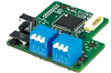
12V/24V and Power ON/OFF Timing Selectable