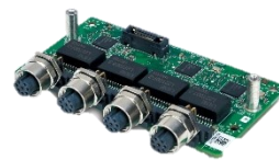
1GbE LAN x4 M12