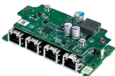
1GbE PoE+ LAN x4 RJ45