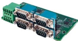
RS232/422/485 x4 8-bit Isolated DIDO