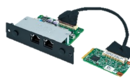
1GbE PoE+ LAN x2 RJ45