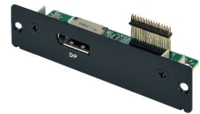
DisplayPort Expansion Module