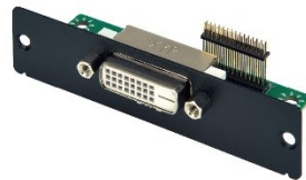
DVI-D Port Expansion Module