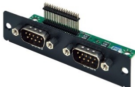
Expansion Module with 2 x RS232 / 422 / 485 (support power 5V/12V)