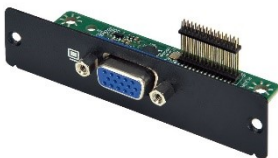
VGA Port Expansion Module