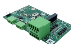
CANBus 2.0B x2 6-bit Isolated DIDO