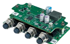
1GbE PoE+ LAN x4 M12