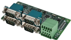
RS232/422/485 x4 8-bit Isolated DIDO